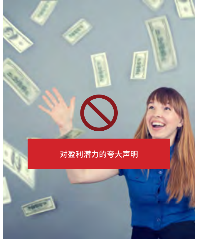
对盈利潜力的夸大声明